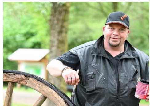
Harm: "Er moest iets gebeuren, want het ging niet goed met me"